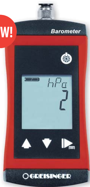
tlakové připojení je díky G 1/8" portu vyměnitelné