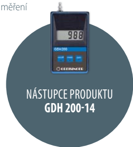
NÁSTUPCE PRODUKTU GDH 200-14